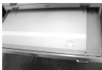
Foto 16: Carpeta Jumbo en cartón Crescent con bisagras de tela para facilitar su apertura.

los dibujos fueron sometidos a una limpieza superficial con brocha y borrador en migas.