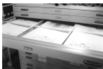
Foto 15: Almacenamiento de los dibujos en carpetas y planeras.