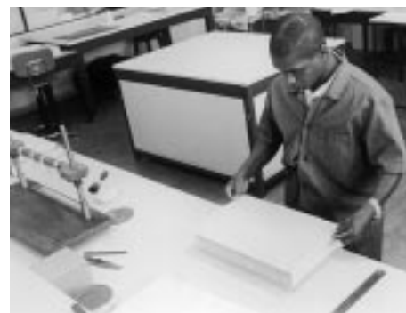
Foto 2. Sección de Conservación y Restauración.

Responsable por las reproducciones fotográficas, micrográficas y digitales del acervo, con el fin de restringir la manipulación de los originales y dar acceso a la información a través de copias y microfilmes. Además de atender a la demanda institucional, dedica gran parte de su trabajo a atender a los usuarios externos.