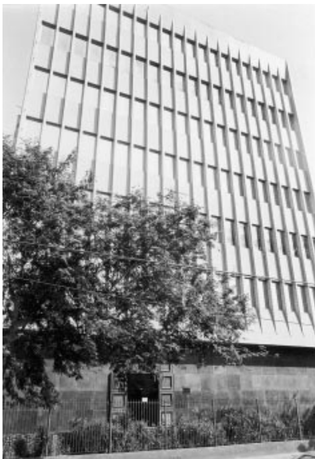
Foto 1. Archivo Nacional del Brasil.