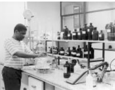
Foto 4. Sección de Química y Biología.